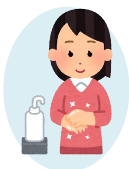
手指の消毒、手洗い