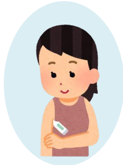
発熱時等入場制限