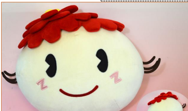
ぼたんちゃんもちふわクッション 2,420円