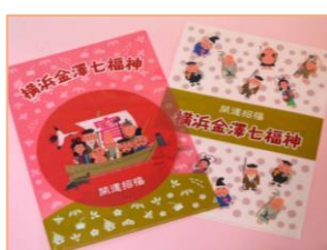
横浜金澤七福神 クリアファイル 550円