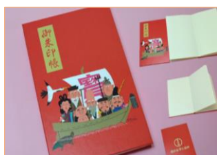
横浜金澤七福神 御朱印帳 1,320円