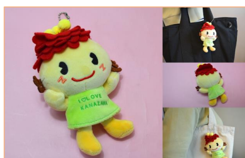
ぼたんちゃんぬいぐるみキーホルダー 1,320円